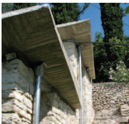
Maîtrise des mises en œuvre, effet de corniches vives (à gauche). Découverte des lieux en arrivant par le haut (à droite).