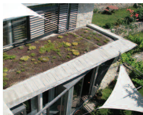
Traitement inventif des dispositifs de protection solaire (débords, lames, toiles...), toitures végétalisées.

discerne quelques lignes horizontales d'où émerge une façon de tour de pierres, reste manifeste de l'enceinte fortifiée. Il faut donc parcourir les ruelles du village pour découvrir en contrebas, formant jardin et potager, quelques terrasses s'appuyant sur de solides murs de soutènement en pierre. Quelques autres terrasses, ceinturées par de vives et élégantes corniches de béton, les prolongent ; ce sont les toitures végétalisées de l'habitation. En dessous se situent donc les espaces habités. On y accède en descendant par le jardin ou par le haut de la tour ; on trouvera aussi un autre accès tout en bas du terrain.