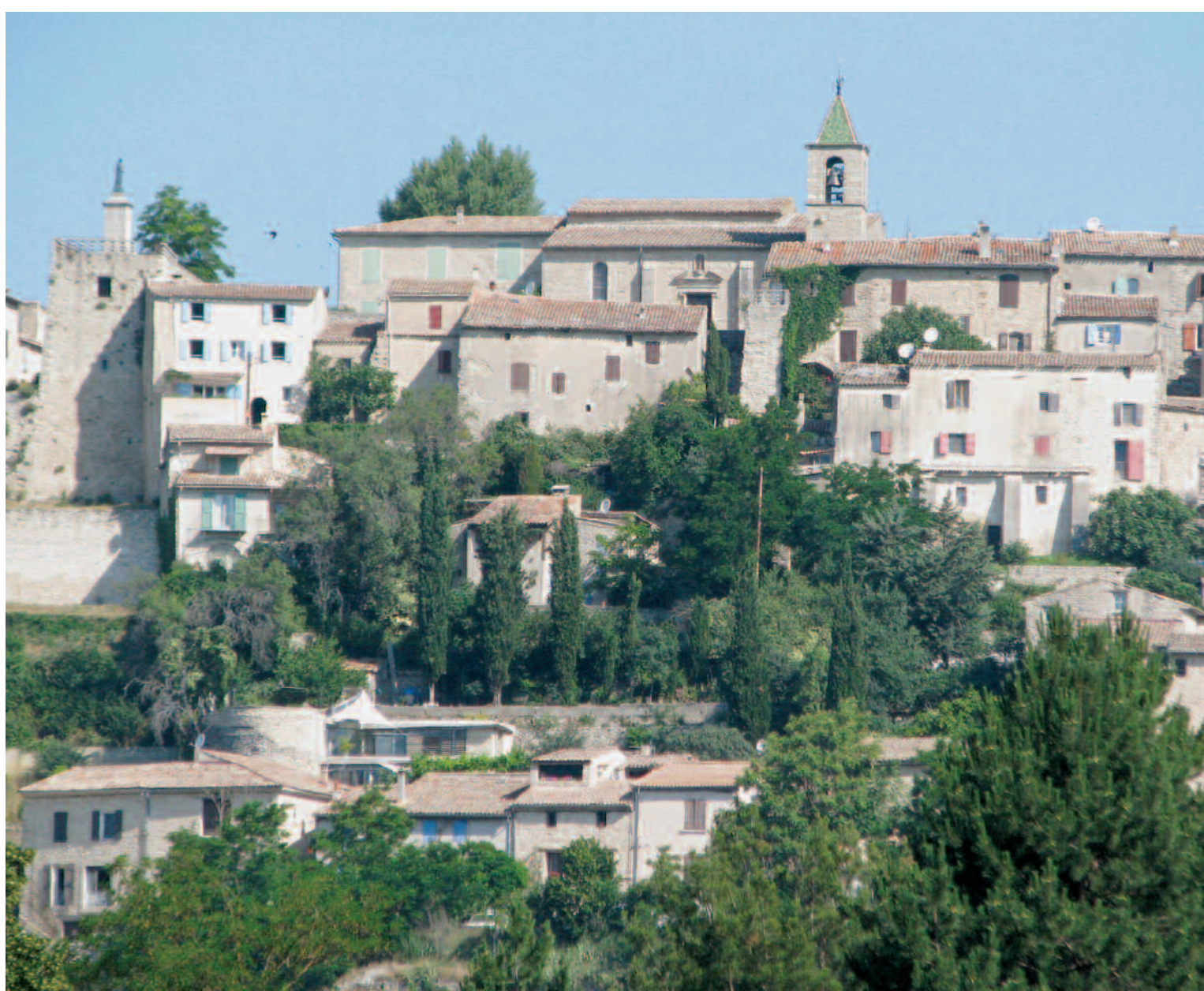
De loin, la maison passe inaperçue (coin inférieur gauche de l'image).

roche, sanitaires originaux très étudiés, menuiseries intégrées... contribuent au plaisir d'un mode de vie très contemporain.