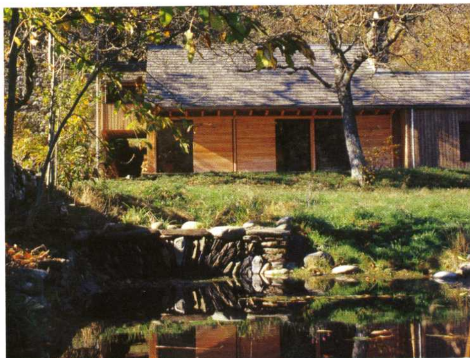
La maison s'étire et les volets coulissent sur les baies.