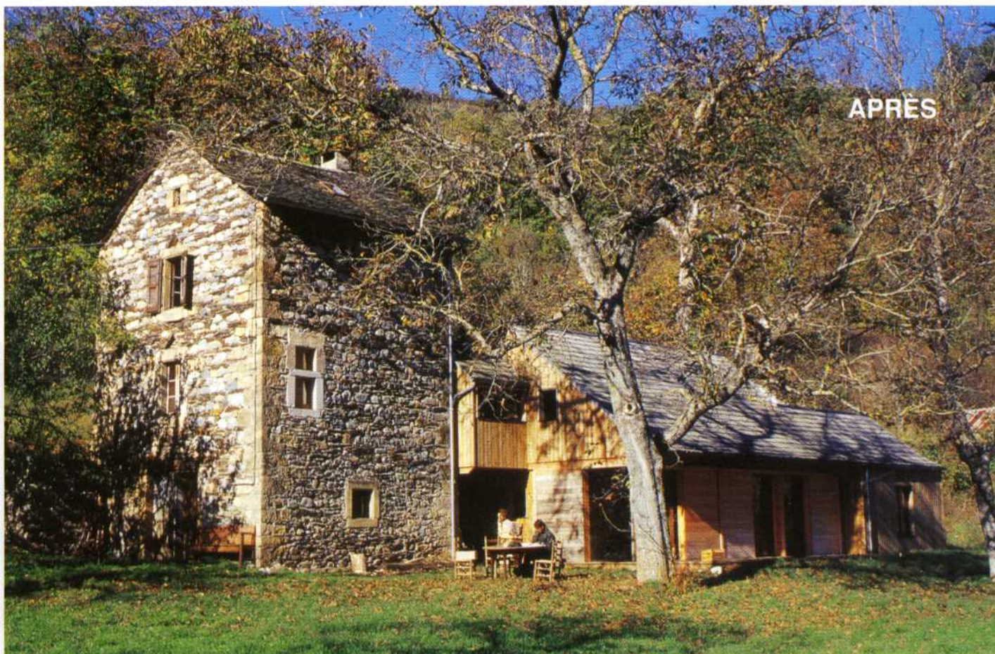
Un passage couvert relie le nouveau bâtiment à l'ancien.