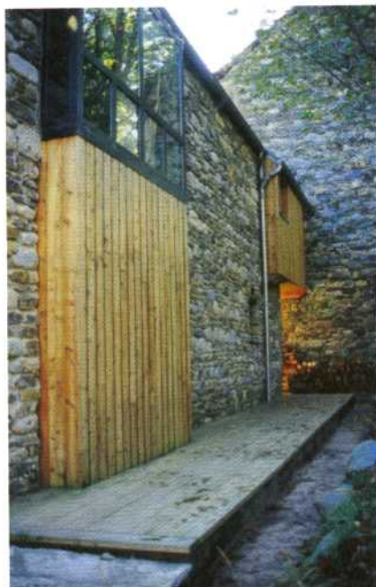
Jeu alterné de bois et pierre côté montagne.