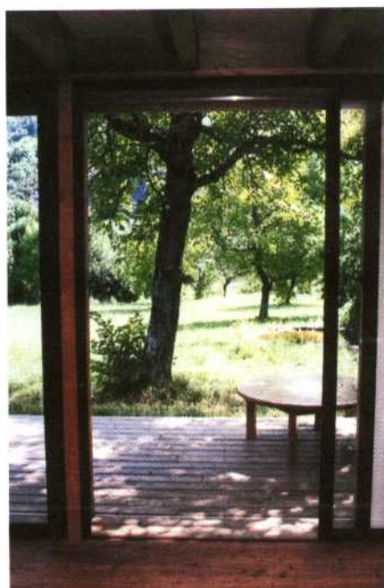
Les ombres diffusent la lumière sur le «deck» côté pré.