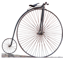
le vélocipède du Dr Herrings