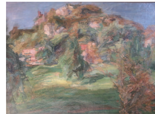
Léon Lehmann, Ferrette en automne (1935).

Offrez de votre temps et de vos compétences.