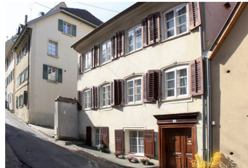
Au 16, rue du Château à Ferrette, la maison Vogelweid-Lehmann...