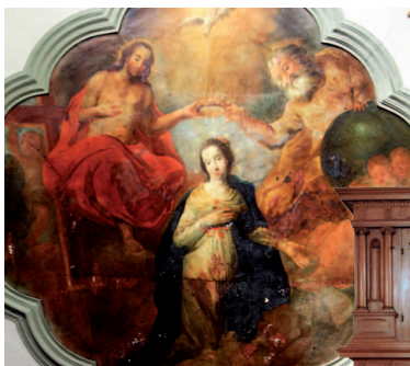
des stucs début 18ème et une représentation du couronnement de la Vierge au plafond

Au cœur de la cité, rue du Château, cette maison de pierres est à vendre. Construite au XVIIe siècle sur les remparts du Moyen Age, elle abritait, jusqu'en 1789, la salle de justice des baillis de Ferrette. Cette salle de tribunal bien préservée est une pièce de musée rare. On y trouve encore :