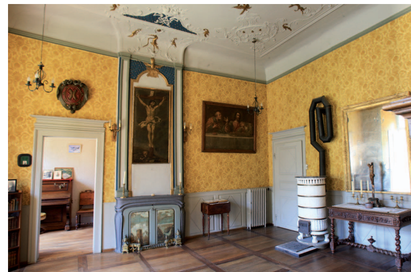
...abrite encore la salle de tribunal d'avant la Révolution.