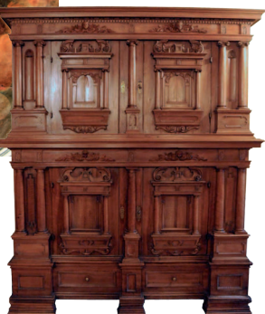
un meuble Renaissance