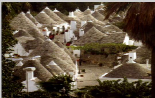
Construction en Pierre Sèche en Italie

Le 2 août 1997, l'Association paraît dans le Journal Officiel de l'État français sous le régime des lois 1901 et 1941 (pas d'incidence de la nationalité sur la qualité de membre et de dirigeant). Depuis, la Société réunit des scientifiques, des amateurs et des institutions qui travaillent pour l'étude, la protection et la conservation des constructions en pierre sèche. Le premier congrès international sur le sujet s'est tenu à Bari (Italie) en septembre 1987.