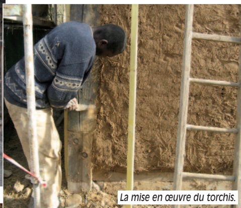
La mise en œuvre du torchis.