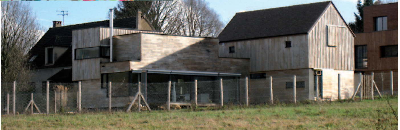
En haut : l'architecte du Parc Bernard Rombauts en réunion de conseil. En bas, la maison BBC. © Jean-Marc Besacier.