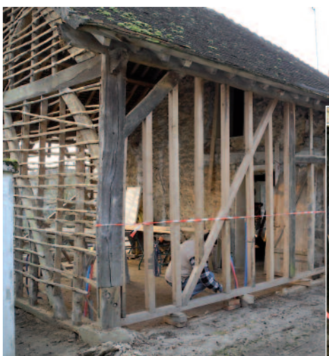
La maison déshabillée de sa terre !

C'est une maison de terre et de bois, un témoin rare dans le Parc car la presque totalité des maisons anciennes sont en pierres maçonnées à la terre. Le nouveau propriétaire a décidé de restaurer le torchis grâce au savoir-faire d'un ouvrier malien de l'entreprise. La terre a été entièrement déposée puis amendée avant d'être malaxée et mise en œuvre comme le torchis d'origine. Un bon exemple de recyclage de matériau sur place. Le Parc souhaite développer cette architecture de terre car cette matière première, considérée souvent aujourd'hui comme un déchet, est sous nos pieds et ne demande qu'à être valorisée.