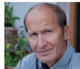
Texte et photos : Bernard Rombauts, architecte conseil du Parc naturel régional de la haute vallée de Chevreuse

On se déplace souvent sur le terrain avec notre « boîte à outil » sous le bras. Ce sont toujours des moments d'échange intenses où se confrontent les goûts et les couleurs.