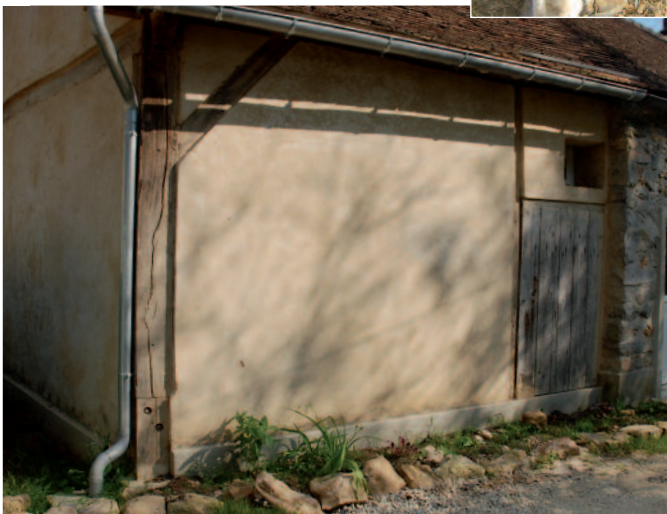
L'enduit terre taloché qui recouvre le torchis.

Je suis intervenu sur ce projet dans une forme de conseil assez classique. Le propriétaire nous a contactés pour avoir des renseignements. Nous lui avons délivré des conseils par courriel, puis par téléphone. En effet, nous n'avons pas les moyens de recevoir toutes les personnes, donc nous essayons au maximum de les renseigner à distance dans un premier temps.