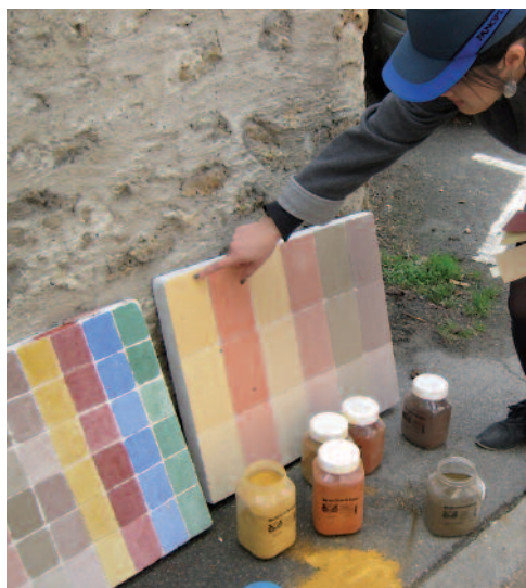
Au pied du mur ! Choix des matériaux et couleurs avec les particuliers. Palette d'échantillons de badigeons réalisés dans le cadre d'une formation avec l'École d'Avignon et le CAUE 78.

Une autre pratique du métier d'architecte ! Des exemples dans le PNR de la haute vallée de Chevreuse.